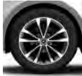
45,7 cm (18") Leichtmetallräder, 5-Doppelspeichen-Design, tremolitgrau, glanzgedreht, Bereifung 245/45 R 18 (R10)