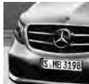
Kühlergrill schwarz lackiert (FK4)