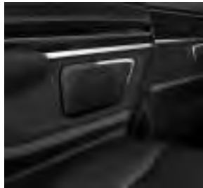
Burmester® Surround-Soundsystem (E65)