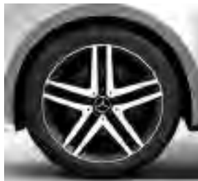
48,3 cm (19") Leichtmetallräder, schwarz lackiert, Front glanzgedreht, mit Bereifung 245/45 R 19 (RL3)