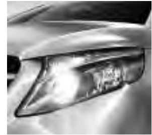
Reflexionsscheinwerfer mit Tagfahrlicht