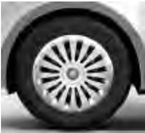
40,6 cm (16") Stahlräder mit Radvollabdeckung, mit 205/65 R 16 auf 6,5 J x 16 ET 52