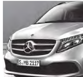
LED Intelligent Light System (LG2 + LG4)