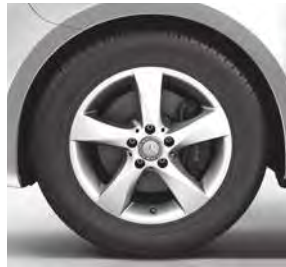
43,2 cm (17") Leichtmetallräder im 5-Speichen-Design, mit Bereifung 225/55 R 17 (RL8)