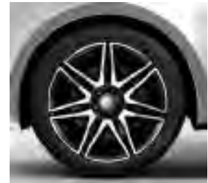
48,3 cm (19") AMG Leichtmetallräder im 7-Doppelspeichen-Design, schwarz glanzgedreht (RK4)