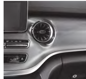
Zierelemente in gebürstetem Aluminium (FB2)