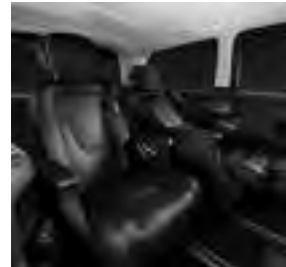
Luxussitze in Liegestellung