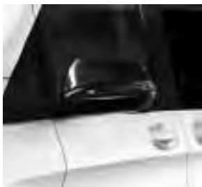
Fahrzeugspiegel in Schwarz lackiert (F3S)

43,2 cm (18") Leichtmetallräder im 5-Speichen-Design schwarz glanzgedreht (R1P) 6)