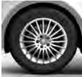
43,2 cm (17") Leichtmetallräder im 20-Speichen-Design, vanadiumsilber lackiert, mit Bereifung 225/55 R 17 auf 7 J x 17 ET 51 (RK8)