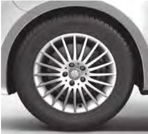
Sport-Paket Exterieur u. a. 43,2 cm (17") Leichtmetallrädern im 20-Speichen-Design, vanadiumsilber lackiert, mit Bereifung 225/55 R 17 (RK8)

V-Klasse EDITION (ZH7) (Auszug zusätzliche Serienumfänge ggü. V-Klasse)