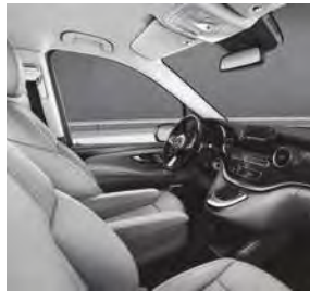
Komfortsitze mit Ziernaht in Leder Nappa in den Farben Schwarz, Seidenbeige oder Tartufo (VY7/V4T/VY9)