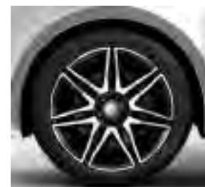
48,3 cm (19") AMG-Leichtmetall- räder, schwarz, glanzgedreht, mit Bereifung 245/45 R 19 (RK4)