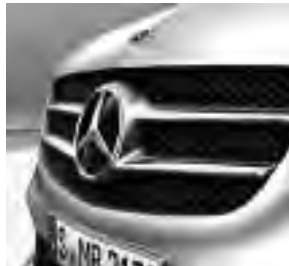
Luftinlass mit Mercedes Stern