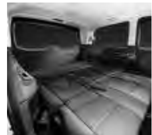
Liege-Paket inklusive 3er-Sitzbank als Komfortliege in der 2. Reihe (V9B)