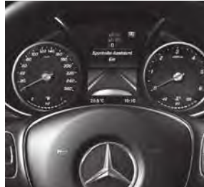
Spur-Paket (JP4) mit Totwinkel- (JA7) und Spurhalte-Assistent (JW5)

V-Klasse AVANTGARDE (VQ1) (Auszug zusätzliche Serienumfänge ggü. V-Klasse)