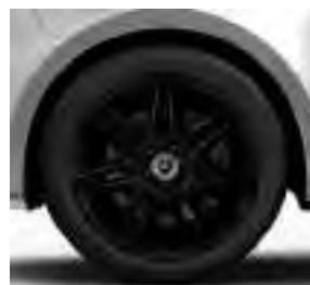
48,3 cm (19") AMG-Leichtmetall- räder, schwarz, mit Bereifung 245/45 R 19 (R1U)