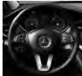
Multifunktionslenkrad im 3-Speichen-Design