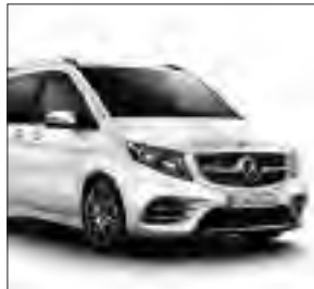
AMG Frontschürze und AMG Seitenschwellerverkleidungen