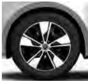
45,7 cm (18") Leichtmetallräder, schwarz, glanzgedreht, mit Bereifung 245/45 R 18 (R1P)