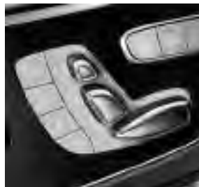
Fahrer- und Beifahrersitz elektrisch einstellbar (SF1/SF2)