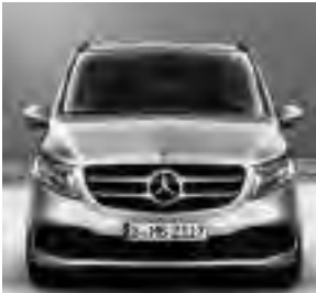
Sportfahrwerk (CF8) (Optional: AGILITY CONTROL Fahrwerk [CA1])