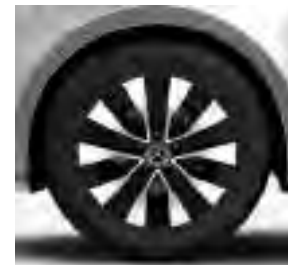
43,2 cm (17") Leichtmetallräder, schwarz, glanzgedreht, mit Bereifung 225/55 R 17 (R1N)