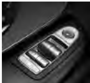
Fensterheber elektrisch 2-fach (mit Sonderausstattung 4-fach)