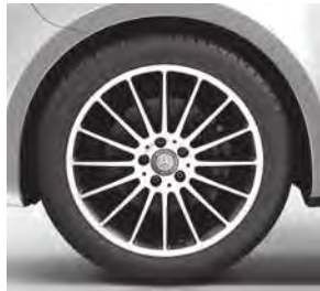
48,3 cm (19") Leichtmetallräder im 16-Speichen-Design, mit Bereifung 245/45 R 19 (RK3) 1)