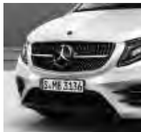
AMG Frontstoßfänger mit Zierelementen in Schwarz (C1L) 4)