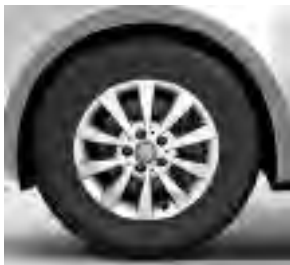
40,6 cm (16") Leichtmetallräder, vanadiumsilber lackiert, mit Bereifung 205/65 R 16 (RL5) 1)