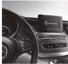
Zierelement Doppelstreifenoptik (F2Z)