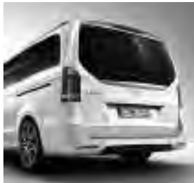
AMG Heckschürze 1) und AMG Abrisskante (FB4)