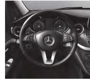
Multifunktionslenkrad Leder Nappa (CL3)