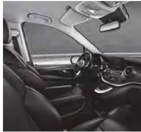
Komfortsitze in Leder Lugano in der Farbe Schwarz