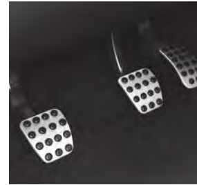
Sportpedale in Aluminium gebürstet (YF3)