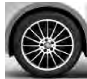
48,3 cm (19") Leichtmetallräder, schwarz lackiert, Front glanzgedreht, mit Bereifung 245/45 R 19 (RK3)