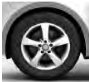
43,2 cm (17") Leichtmetallräder, vanadiumsilber lackiert, mit Bereifung 225/55 R 17 (RL8)