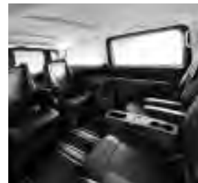
4 Einzelsitze im Fond