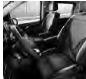
Polsterung Stoff Santos