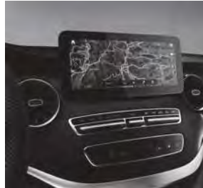
Navigation (E1E) mit Verkehrszeichen-Assistent (JA9) und Burmester® Surround-Soundsystem (E65)