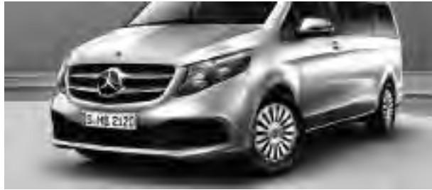
2-Lamellen-Kühlerverkleidung in Silber glänzend