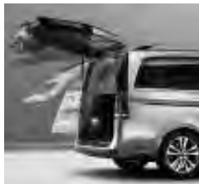
EASY-PACK Heckklappe (W68)