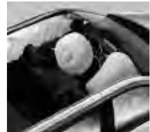
Airbags, Thorax-Pelvis-Sidebags und Windowbags für Fahrer und Beifahrer