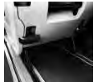
Sitzschienensystem mit Schnellverriegelung zum Ein- und Ausbau der Fondsitze