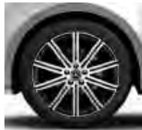
48,3 cm (19") Leichtmetallräder, schwarz, glanzgedreht, mit Bereifung 245/45 R 19 (R1Q)