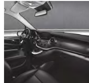
Leder Lugano (VX7/VX9), Zierelement Doppelstreifenoptik (F2Z)