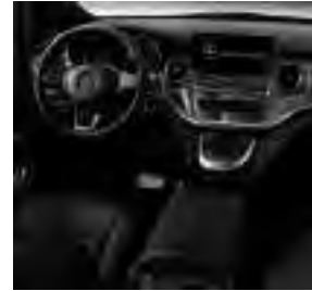
Mittelkonsole mit Kühlfach (FG6)