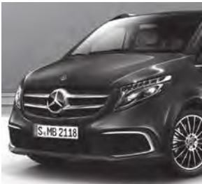
Chromzierstab im vorderen Stoßfänger

V-Klasse EXCLUSIVE (VQ8) und EXCLUSIVE EDITION (Z9G) (Auszug zusätzliche Serienumfänge ggü. V-Klasse AVANTGARDE EDITION [ZH8])