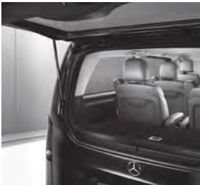
Separat zu öffnende Heckscheibe (W64)

V-Klasse AVANTGARDE (VQ1) (Auszug zusätzliche Serienumfänge ggü. V-Klasse)