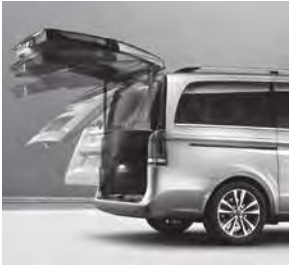
EASY-PACK Heckklappe elektrisch (W68)

V-Klasse AVANTGARDE EDITION (ZH8) (Auszug zusätzliche Serienumfänge ggü. V-Klasse AVANTGARDE [VQ1])