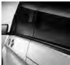
Bordkantenzierstab schwarz (FK5)