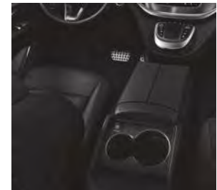
Mittelkonsole mit Kühlfach (FG6)