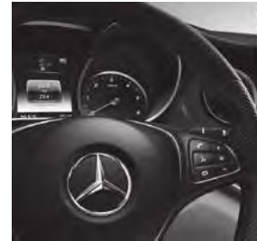
Multifunktionslenkrad Leder Nappa (CL3)