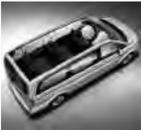
Windowbags für Fahrer, Beifahrer und im Fond (SH8)