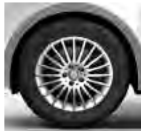
43,2 cm (17") Leichtmetallräder, vanadiumsilber lackiert, mit Bereifung 225/55 R 17 (RK8)