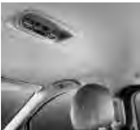
Klimatisierungsautomatik THERMOTRONIC (HH4) und Klima- automatik TEMPMATIC im Fond (HZ7)