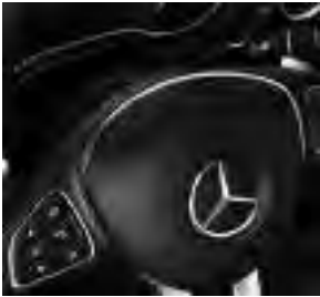
9G-TRONIC inkl. TEMPOMAT, DIRECT SELECT Wählhebel, Lenkradschaltpaddles und DYNAMIC SELECT