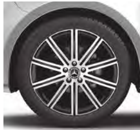
48,3 cm (19") Leichtmetallräder, 10-Speichen-Design, schwarz, glanzgedreht, mit Bereifung 245/45 R 19 (R1Q) 2)