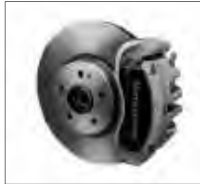
43,2 cm (17") Bremsanlage an der Vorderachse und Bremssättel mit „Mercedes-Benz“ Schriftzug