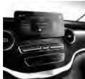
Zierelemente Carbonoptik (FB1) und Sportpedalanlage (YF3)