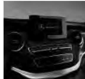
Zierelement Klavierlackoptik schwarz glänzend