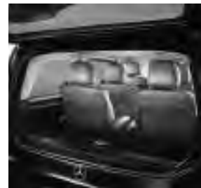
Separat zu öffnende Heckscheibe (W64) und Laderaumunterteilung (YG4)