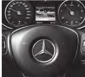
Fahrerassistenz-Paket (JP2) mit u. a. Aktivem Brems-Assistenten (BA3) und PRE-SAFE® System (JP1)