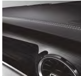
Zierelemente Holzoptik Ebenholz Dunkelathrazit (FH9) und Instrumententafel in Lederoptik mit Ziernaht