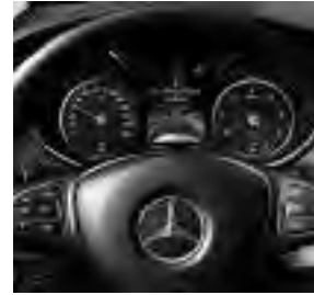
Active Distance Assist DISTRONIC (ET4)