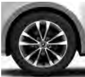
45,7 cm (18") Leichtmetallräder, tremolitgrau, glanzgedreht, mit Bereifung 245/45 R 18 (R10)