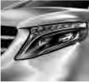
LED Intelligent Light System (LG2 + LG4)