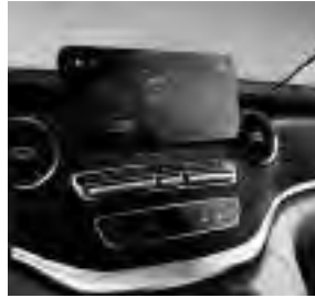
26 cm (10,25") HD-Touch-Display (E1F)