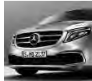
Chromzierstab im Stoßfänger