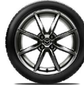
17-Zoll-Leichtmetallfelgen Bright Dark