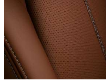
Nappalederausstattung 1) Terracotta