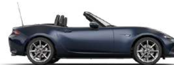
DEEP CRYSTAL BLUE (42M) 3)

1) Sitzmittelbahn und -wangen in Leder 2) Sitzmittelbahn in Alcantara®-Stoff. Sitzwangen und Kopfstützen in Leder. 3) Metallic-Lackierung 4) Sonderfarbe