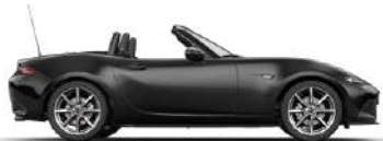
JET BLACK (41W) 3)