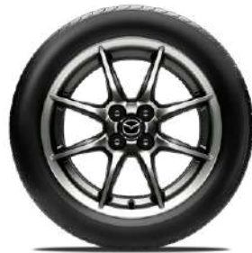
16-Zoll-Leichtmetallfelgen Bright Dark