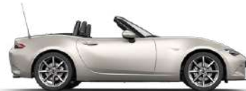
PLATINUM QUARTZ (47S) 3)