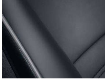
RECARO® Sportsitze 2)