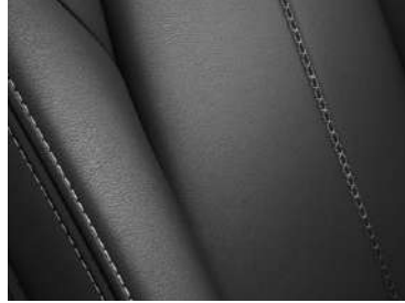
Lederausstattung 1) Schwarz