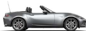
MACHINE GREY (46G) 4)