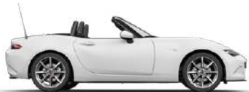
ARCTIC WHITE (A4D)