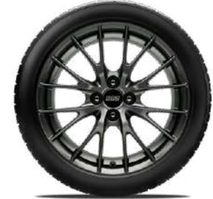
BBS® 17-Zoll-Leichtmetallfelgen geschmiedet