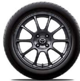
RAYS® 16-Zoll-Leichtmetallfelgen geschmiedet