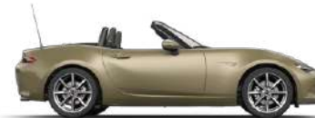
ZIRCON SAND (48T) 3)