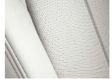
Nappalederausstattung 1) Weiß