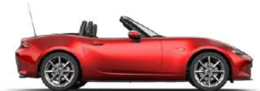
SOUL RED CRYSTAL (46V) 4)