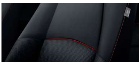
Stoffbezug in Schwarz mit roten Kontrastnähten