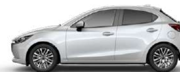
SNOWFLAKE WHITE (25D) 1)