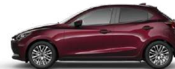
DEEP CRIMSON (45R) 1)