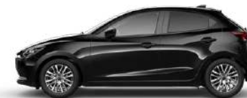
JET BLACK (41W) 1)