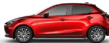
SOUL RED CRYSTAL (46V) 2)