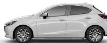
ARCTIC WHITE (A4D)