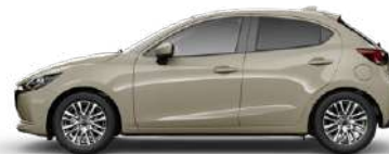
PLATINUM QUARTZ (47S) 1)