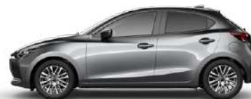
MACHINE GREY (46G) 2)