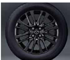
16-Zoll-Leichtmetallfelgen in Schwarz