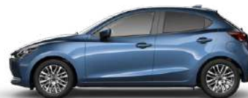
ETERNAL BLUE (45B) 1)