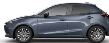
POLYMETAL GREY (47C) 2)