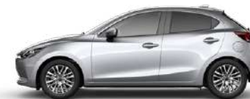
SONIC SILVER (45P) 1)