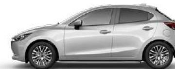
CERAMIC WHITE (47A) 1)