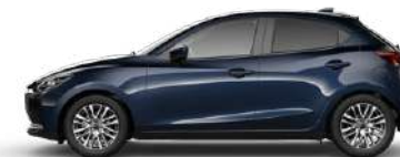
DEEP CRYSTAL BLUE (42M) 1)