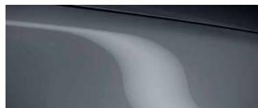
POLYMETAL GREY (47C) 6)