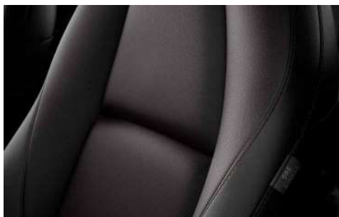
Lederausstattung* in Schwarz (Kontrastelemente der Mittelkonsole, des Armaturenbretts und der Dekor-Elemente in den Seitentüren in Braun)