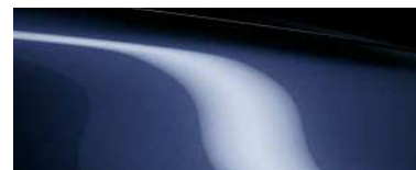
DEEP CRYSTAL BLUE (42M) 5)