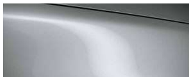
SONIC SILVER (45P) 5)