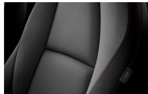
Stoffbezug in Schwarz mit roten Ziernähten in Bezug, Armaturenbrett und Mittelarmlehne