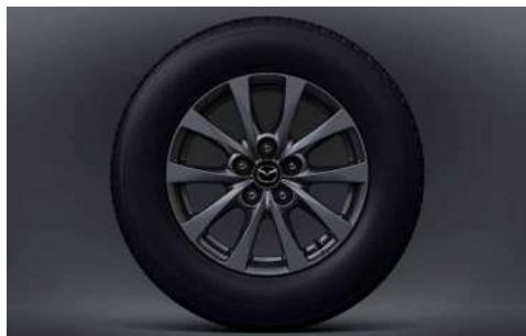
16-Zoll-Leichtmetallfelgen in Grau