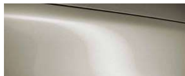
PLATINUM QUARTZ (47S) 5)