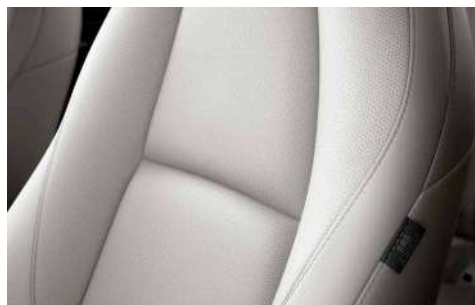
Lederausstattung* in Pure-White (Kontrastelemente der Mittelkonsole, des Armaturenbretts und der Dekor-Elemente in den Seitentüren in Braun)