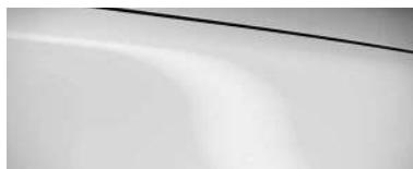
ARCTIC WHITE (A4D)