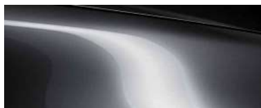
MACHINE GREY (46G) 6)