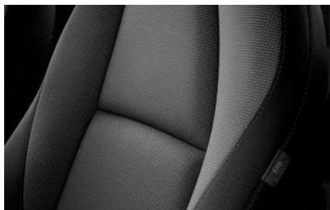
Stoffbezug in Dunkelgrau (Kontrastelemente der Mittelkonsole, des Armaturenbretts und der Dekor-Elemente in den Seitentüren in Schwarz)