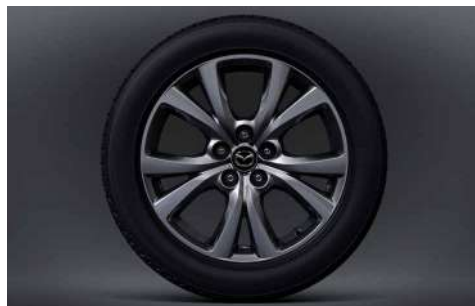
18-Zoll-Leichtmetallfelgen in Silbergrau mit Hochglanzfinish