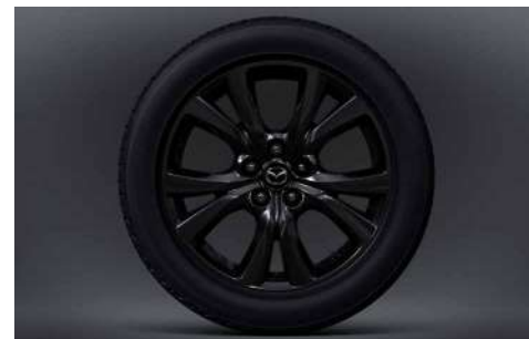
18-Zoll-Leichtmetallfelgen in Schwarz