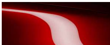
SOUL RED CRYSTAL (46V) 6)